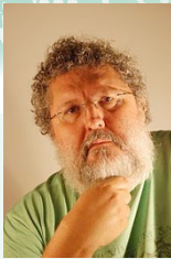
Por Zeca Pontes