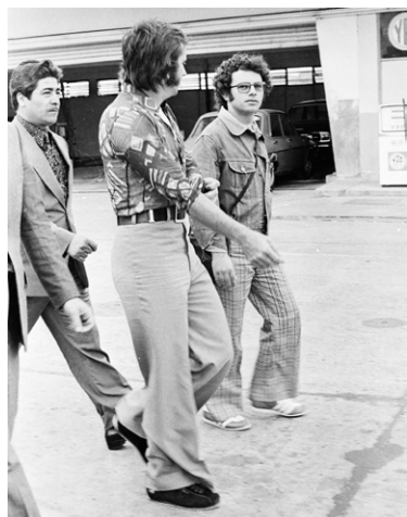
... em 1973, acompanhando Emerson Fittipaldi na F1, em Buenos Aires, ...