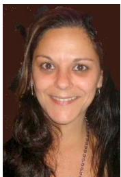
Por Heloisa Valente