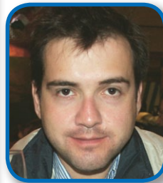
Por Luís Perez

“Cada dia com um carro”, jornalista automobilístico passa por situações de conflito e até inusitadas