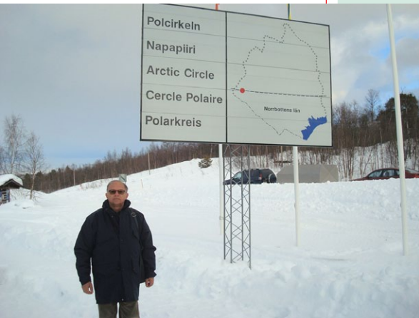
... no Circulo Polar Ártico, na Suécia, ...