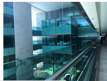
Imagens internas da nova sede da Infoglobo