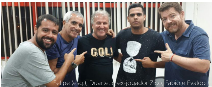
Felipe (esq.), Duarte, ex-jogador Zico, Fábio e Evaldo

samba e conhece futebol. Com atrações antes e no decorrer das partidas, vai convidar personalidades a cada edição, incluir música nas transmissões e juntar as duas paixões dos brasileiros, o Carnaval e o futebol. Fábio Calhau responde pela engenharia necessária para pôr a rádio no ar. ► De início, a Webrádio SRzd vai transmitir jogos das principais competições do ano, como Campeonato Estadual do Rio de Janeiro, Taça Libertadores, Sul-Americana e Brasileiro. O modelo implantado no Rio em breve será oferecido também em São Paulo, com equipe da própria cidade.