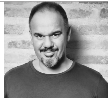
Imagem Corporativa amplia carteira e contrata