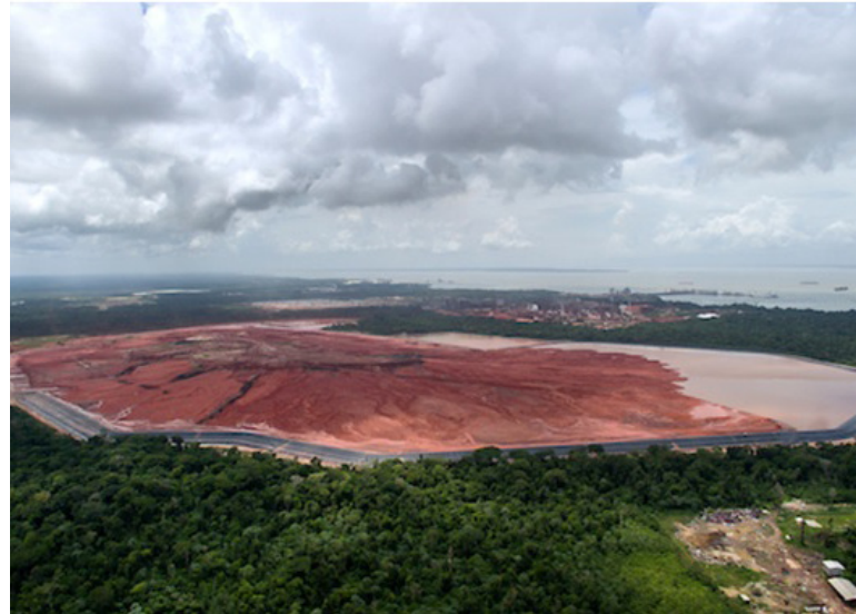
Depósito de rejeitos da produção de alumina da Norsk Hydro em Barcarena (PA)