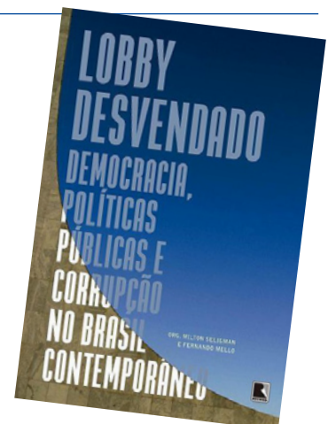
Latino-Americano de Jornalismo Investigativo e Esso de Melhor Contribuição para a Imprensa.