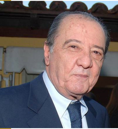
Aureliza Correia/Esp. CBI/D.A.Press - 22/7/2008