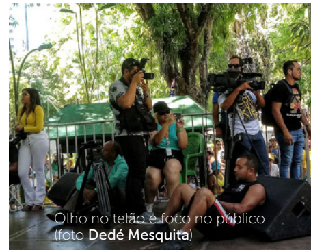
Olho no telão e foco no público

► Em 2/7, a Prefeitura de Belém transmitiu o jogo Brasil x México em telão na praça Batista Campos, no bairro homônimo, como parte do evento Belém na Copa , iniciativa da Fundação Cultural do Município. Os jornalistas da capital paraense estavam por lá.