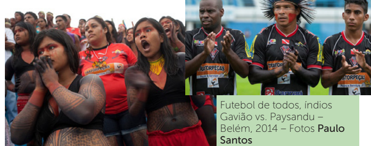
Futebol de todos, índios Gavião vs. Paysandu – Belém, 2014