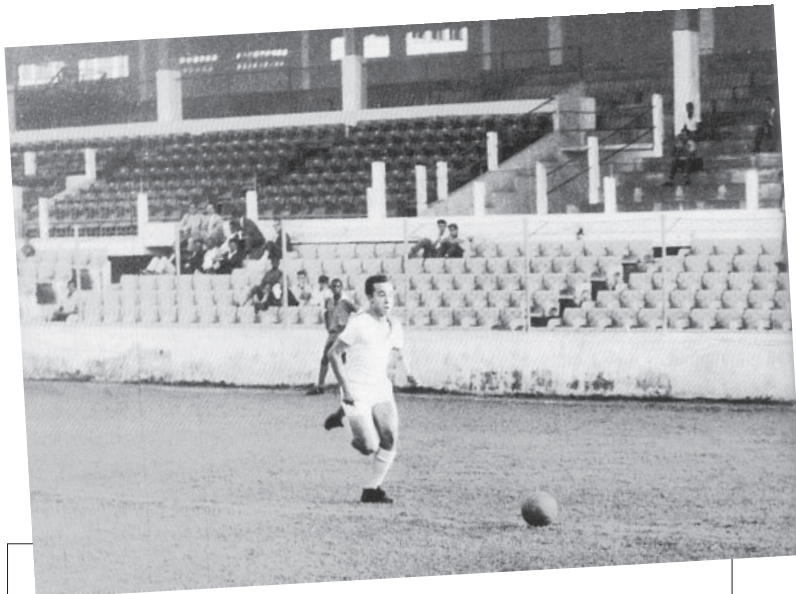
Aos 15 anos, no juvenil do América

cia em uma partida. Com o tempo, por mais que visse, escutasse e estudasse futebol, percebi que sabia pouco, cada vez menos, e que muitas das análises táticas e técnicas, a que dava tanta importância, tinham pouca ou nenhuma importância. Talvez tenha aprendido a separar o que é fundamental do supérfluo e o que é certo do que gosto. Percebi ainda que, quando existe pequena diferença técnica entre duas equipes, o resultado de um jogo depende menos desses detalhes técnicos e táticos e mais do erro de um árbitro, de uma bola que bateu em alguém e mudou a trajetória e de tan-